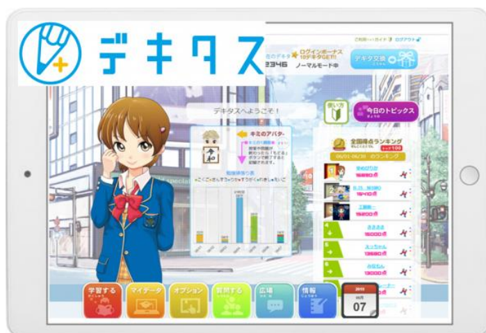
（オンライン学習教材「デキタス」）

城南進学社は、総合教育ソリューション事業として、乳幼児期から社会人まで「能力開発」をモットーに、幅広い年齢層に対しブランド展開をしております。近年では、中期経営計画として「学びの個別最適化」を追求し、オンライン学習教材「デキタス」をはじめとした在宅学習（遠隔指導）によるサービス展開モデルを構築。さらに、付加価値の高い「幼少教育事業」の確立のため、女性の社会進出をサポートする保育ブランドの強化、英語系学童・インターナショナルスクールの拡大、「城南ブレインパーク」など STEAM を中心とした乳幼児教育サービスの充実など、様々な取り組みを行っています。